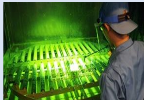
浸透探傷検査OJT(イメージ)