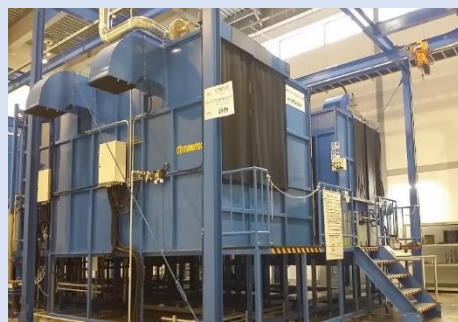
浸透探傷検査装置No.2